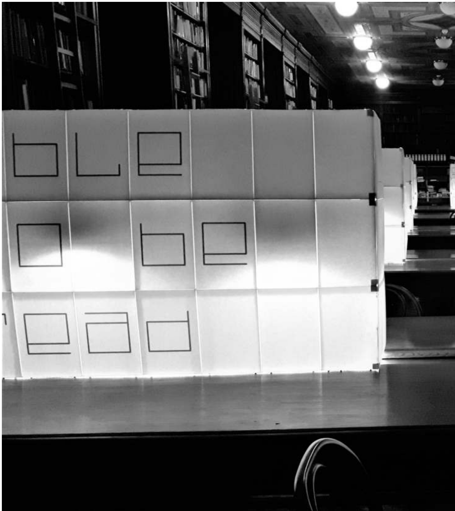
verwendete buchstaben aus alphabet nr 2 (c) thomas laubenberger-pletzer einzeln gedruckt auf papier